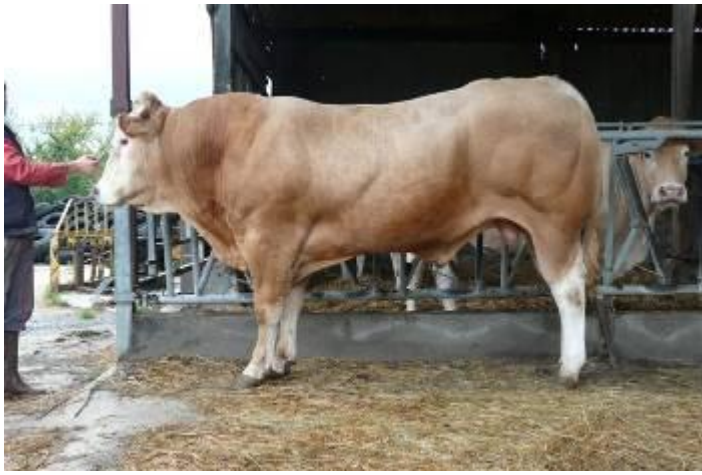
Ballon à la station