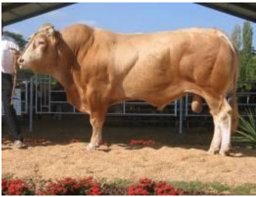
Son père : Théodule