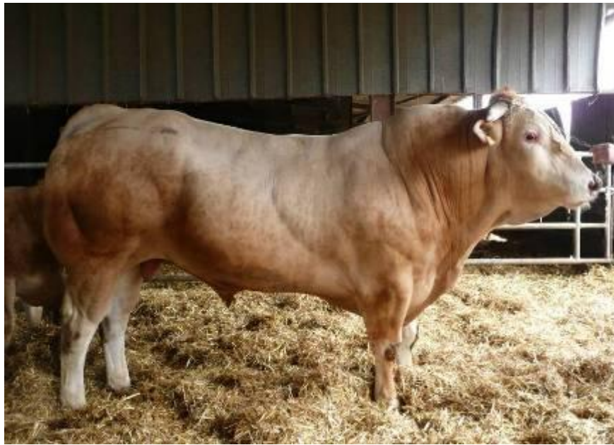
Ballon Avril 2010 à l'Earl Sausuel