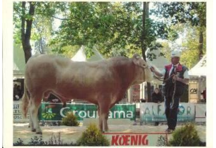
Ballon Luneville 2008