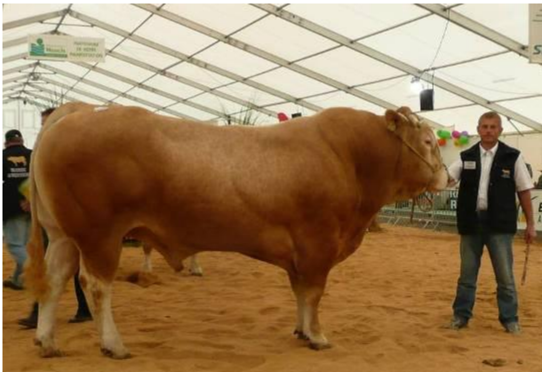
Champion adulte 2010 - Interregional grand-est - Metz