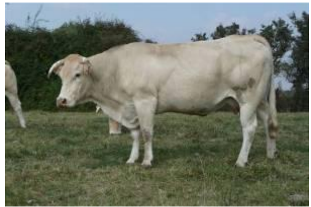
Sa mère : Paillarde

Nom : BALLON N° National : FR 81 2413 7636 Né le : 27/09/2006